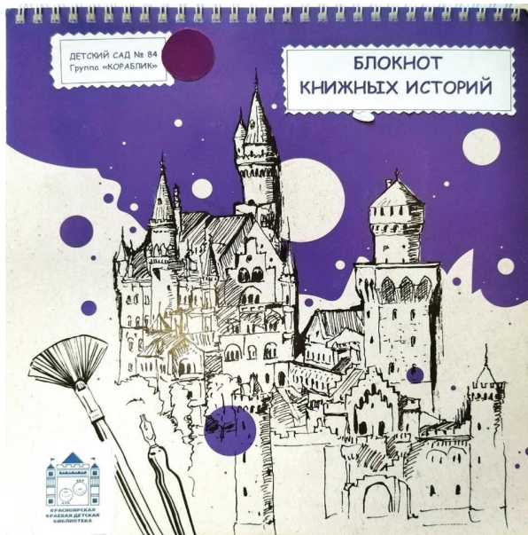
Блокнот книжных историй