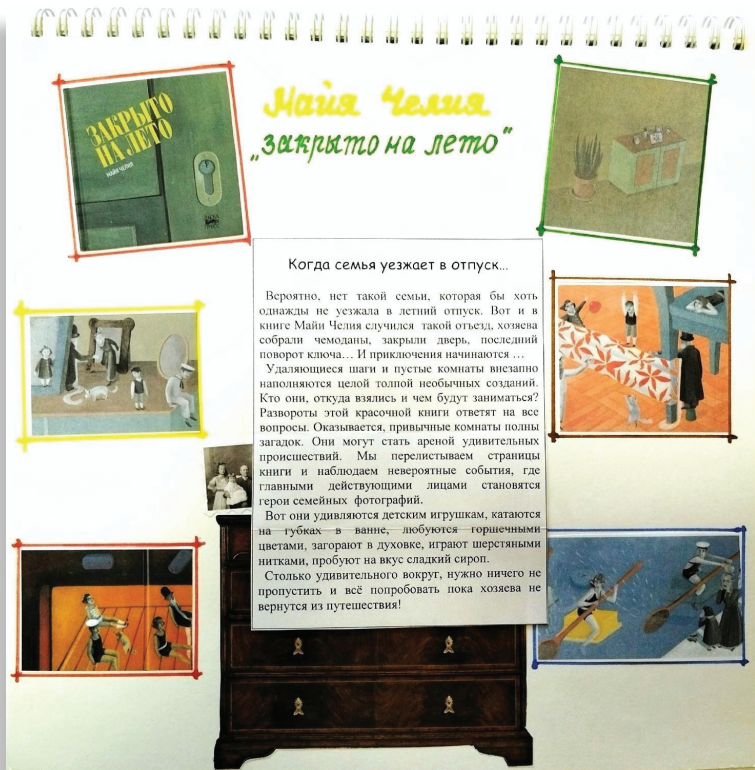
Страничка из «Блокнота книжных историй»